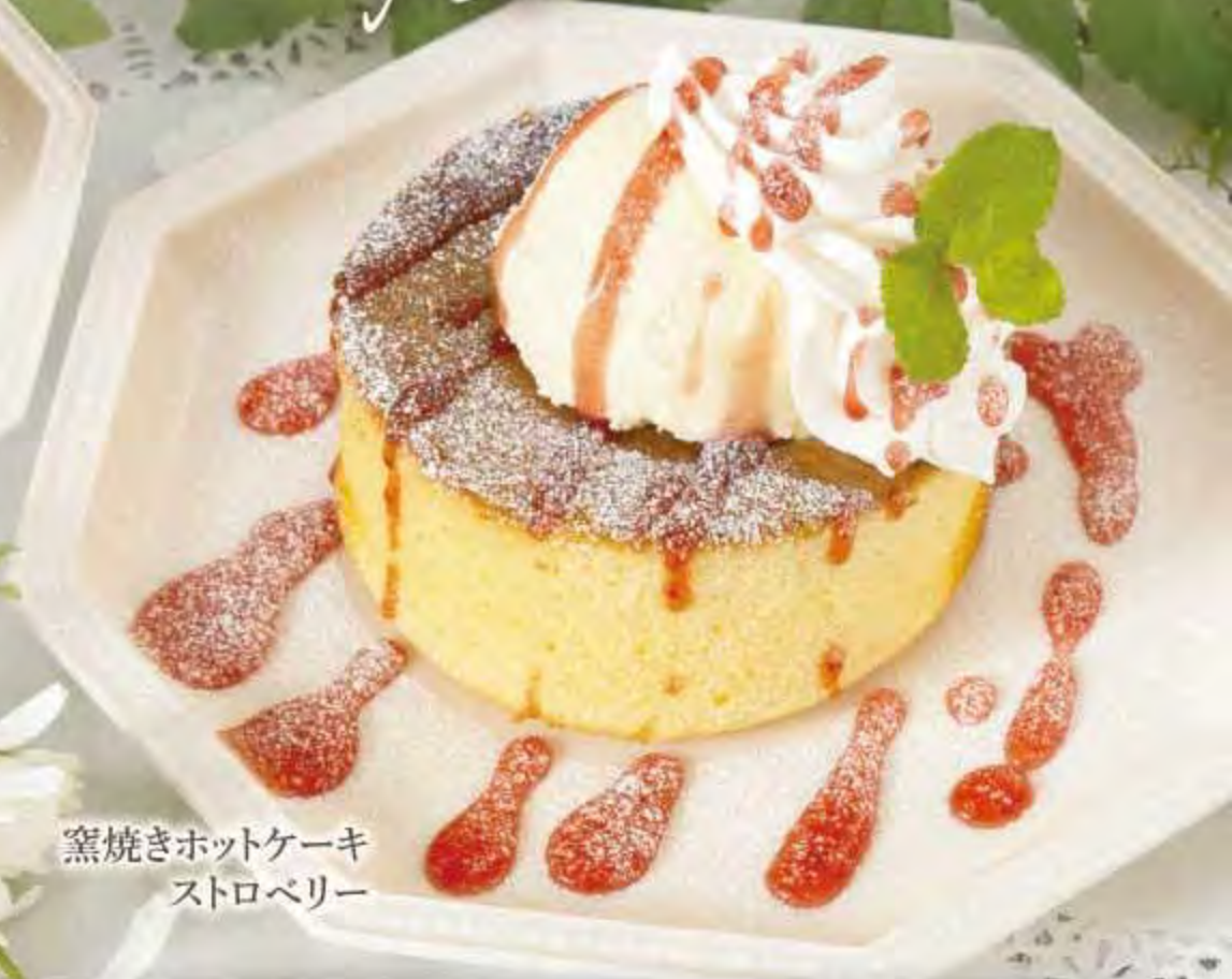
窯焼きホットケーキ ストロベリー