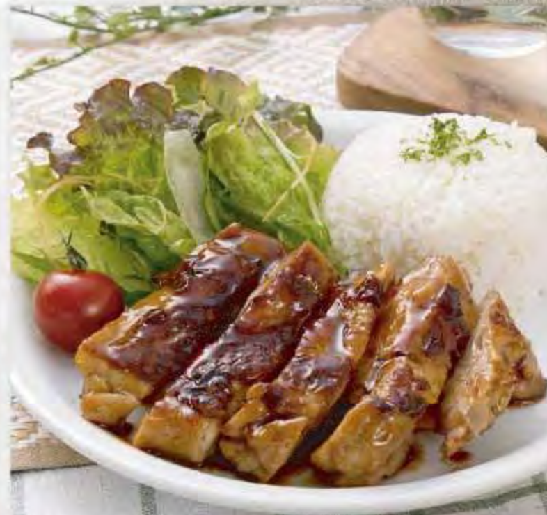
グリルチキンプレート