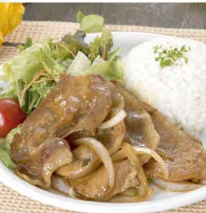
豚の生姜焼きプレート