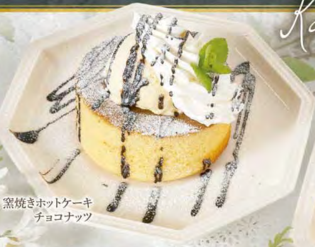
窯焼きホットケーキ チョコナッツ

窯(オープン)でじっくりと焼き上げたふんわり、しっとり食感の厚焼きホットケーキです。