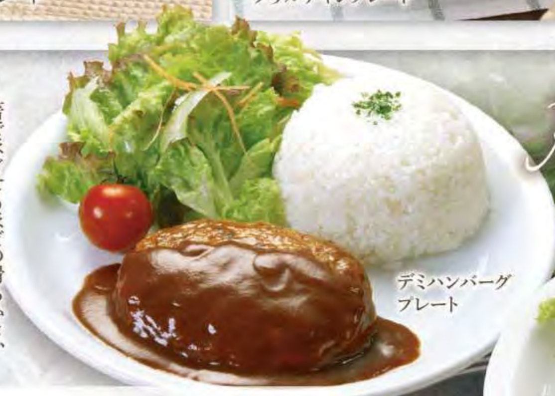
デミハンバーグプレート

箸でほぐせるほどの滑らかさ、柔らかさが自慢です。カットした時に溢れる肉汁が美味しさを醸し出す、当店オススメのハンバーグです。