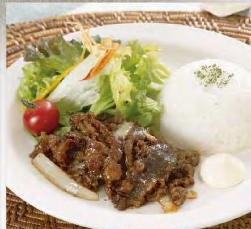
スタミナ焼肉プレート

箸でほぐせるほどの滑らかさ、柔らかさが自慢です。カットした時に溢れる肉汁が美味しさを醸し出す、当店オススメのハンバーグです。